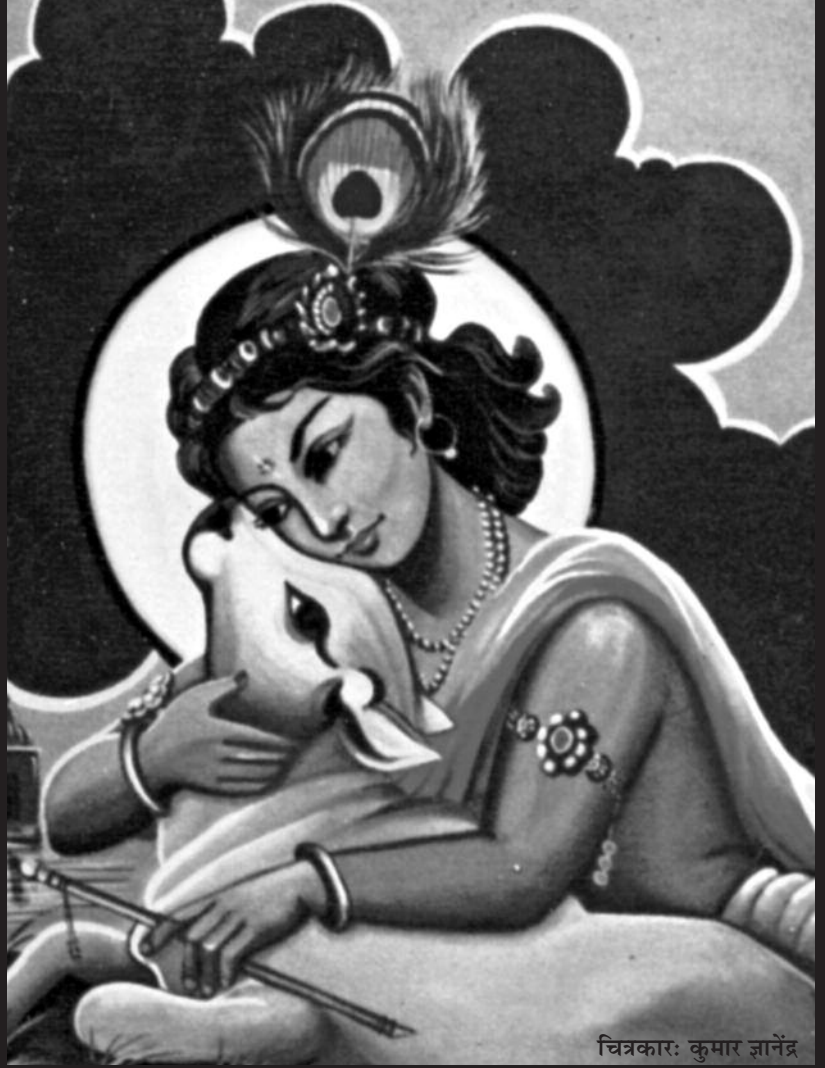
चित्रकार: कुमार ज्ञानेंद्र

आज भारत वर्ष में ही करोड़ों लोग सुबह शाम देवालयों में माथा टेक कर भगवान से मनोकामनाएँ मांगते हैं, पर इन में से लाखों लोगो को यह तक भी मालूम नहीं है की जिस देवता से वे याचना कर रहे है उन्हें कुछ भी दे देने की शक्ति तभी आएगी जब हवन द्वारा अग्नि के मुख से देवताओं तक शुद्ध गौ घृत पहुंचेगा। जब हम हवन में गाय के घी से मिश्रित चरु देवताओं को अर्पण करते हैं। उस उत्तम हविष्य से देवता बलिष्ठ एवं पुष्ट होते हैं। जब देवता शक्तिशाली होगा तभी अपनी शक्ति के बल पर आपकी-हमारी मनोकामनाएं पूरी करने में समर्थ होंगे। पर जब गौवंश ही नहीं रहेगा तो शुद्ध गौ घृत कहा से आएगा और शुद्ध गौ घृत नहीं होगा तो हवन कहा से होगा और हवन नहीं होंगे तो देवता पुष्ट कैसे होंगे और देवता पुष्ट नहीं होंगे तो शक्तिहीन देवता मनोकामनाएं पूर्ण कैसे करेंगे। आज हम लोग पेड़ लगा देते है पानी खाद नहीं डालेंगे तो फल कहां से लगेगे। यह प्रकृति के नियम के विरुद्ध है। आज जितने भी कथाएं होती है, यज्ञ, अनुष्ठान होते हैं, जप-तप होते हैं, उनमें नाम-जप का कुछ प्रभाव पड़ता हो पर अंत में जो यज्ञ होता है वह